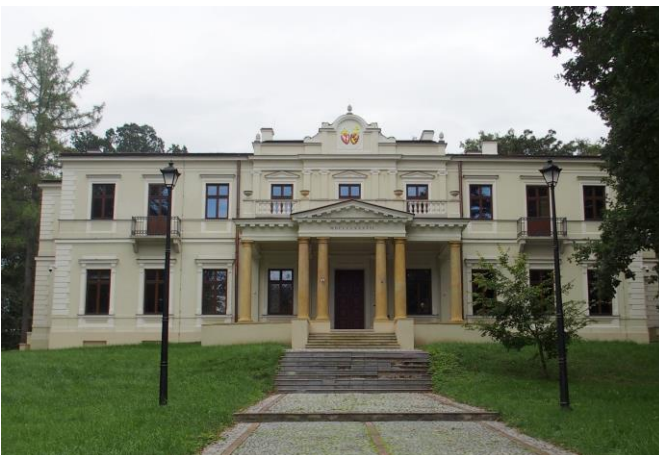
Fot. nr 7. Pałac Wielopolskich, ob. Muzeum Historyczno-Archeologiczne ul. Świętokrzyska 37

Budynek dawnej Kasy Chorych, ob. Środowiskowy Dom Samopomocy dla Osób Niepełnosprawnych Intelaktnie oraz Dom Ulgi w Cierpieniu im. Jana Pawła II, ul. Focha 5. Zbudowany w latach 1925-1927, zbudowany wg projektu R. Weindlinga (?) - nietypowy dla twórczości tego modernistycznego architekta, gdyż prezentuje walory neobaroku. Monumentalny, założony na rzucie litery E, trójkondygnacyjny, nakryty wysokimi czterospadowymi dachami rozczłonkowanymi lukarnami. Na osi fasady i w narożach elewacji - ryzality, z których fasadowy zwieńczony jest rozległą, prostokątną facjatą z trójkątnym szczytem. W wystroju fasady dominują pilastry w porządku wielkim, z jońskimi głowicami. Budynek po remoncie.