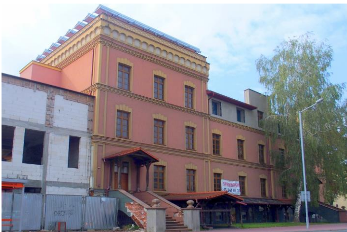
Fot. nr 13. Hotel Fabryczny, ul. Sandomierska 4

Pozostałe obiekty zabytkowe, wartościowe dla krajobrazu kulturowego miasta to: dawny hotel fabryczny wzniesiony w 1905 r., z elementami neogotyckimi w wystroju oraz budynek dworca PKP wzniesiony w latach 1885-1886, w stylu typowym dla budynków dworców kolejowych tego okresu (obiekt nieczynny, ulega degradacji).