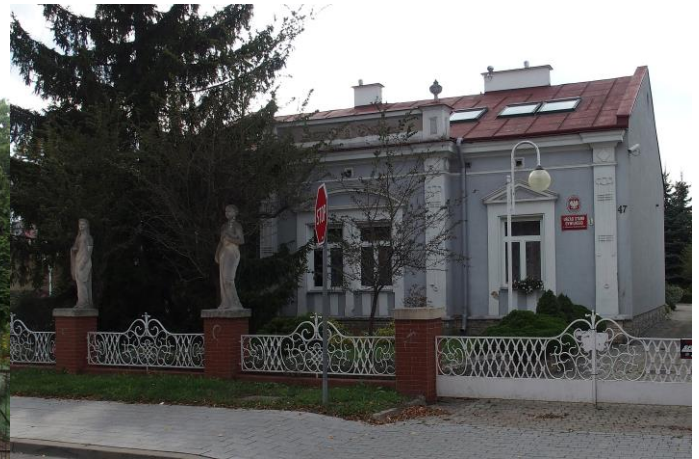
Fot. nr 12. Willa Saskich, ob. USC, ul. Siennieńska 47

Dworek inż. Straussa , ul. Siennieńska 37, wzniesiony ok. 1915 r. w stylu dworkowym. Parterowy budynek nakryty dwuspadowym dachem, z pseudoryzalitem zwieńczonym pełnym murkiem attykowym – w skrajnej osi fasady i prostokątnym podcieniem wspartym na czterech kolumnach, zaakcentowanym trójkątnym frontonem. Ściany murowane, boniowane, wokół okien i drzwi opaski i odcinki gzymsu.