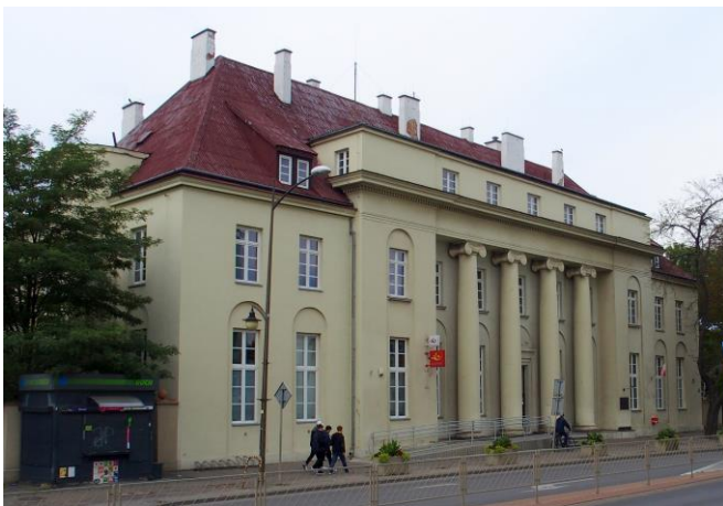
Fot.1. Budynek Poczty, Al. 3 Maja 12

Wymienieni architekci i urbaniści byli twórcami najważniejszych obiektów architektonicznych Ostrowca Świętokrzyskiego powstałych w okresie 4 ćw. XIX w.-lata 50. XX w. Najcenniejszymi, ze względu na unikatowość architektury są budynki: