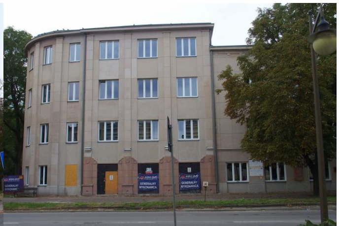
Fot. 2. Dom Robotniczy, Zakładowy Dom Kultury, ob. m.in. kino „Etiuda” i Centrum Tradycji Hutnictwa, Al. 3 Maja 6

Gmach Poczty , Aleja 3 Maja 12, wzniesiony w latach 1926-1927 wg projektu Witolda Minkiewicza. Dwukondygnacyjny budynek nakryty wysokim czterosпадowym dachem, z rozległą facjatą w szerokości płytkiego frontowego ryzalitu. Wyróżnia się monumentalną kolumnadą w stylu palladiańskim wprowadzoną w prostokątnym podcieniu frontowego ryzalitu. Walorem budynku jest prostota i monumentalizm bryły niemal pozbawionej detali zdobniczych.