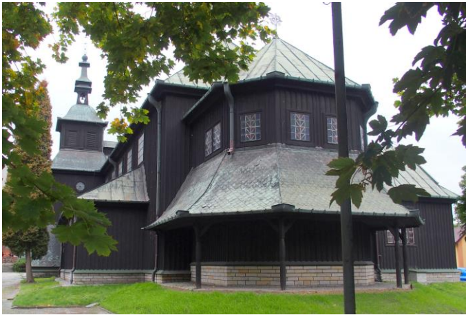
Fot. nr 3. Kościół pw. Najświętszego Serca Jezusowego, ul. Poniatowskiego 4

Spośród obiektów sakralnych najbardziej wartościowymi pod względem walorów architektonicznych, artystycznych i historycznych są: