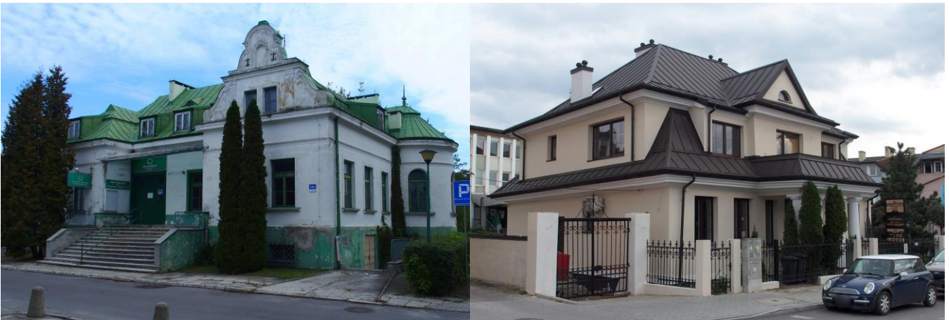
Fot. nr 9. Pałacyk Rylla, ob. budynek nieużytkowany, Al. 3 Maja 13a Fot. nr 10. Willa Żakowskich, ul. Siennieńska 14

Inne reprezentacyjne budynki mieszkalne na terenie Ostrowca Świętokrzyskiego to: dworek administratora dawnej cukrowni, tzw. Dyrektorówka, ob. budynek mieszkalny, zbudowany w 1877 r., opuszczony i zaniedbany, podobnie jak willa dyrektora Huty Klimkiewiczów przy ul. Focha wzniesiona na przełomie XIX/XX w. Wśród willi miejskich w krajobraz kulturowy Ostrowca Świętokrzyskiego wpisały się: