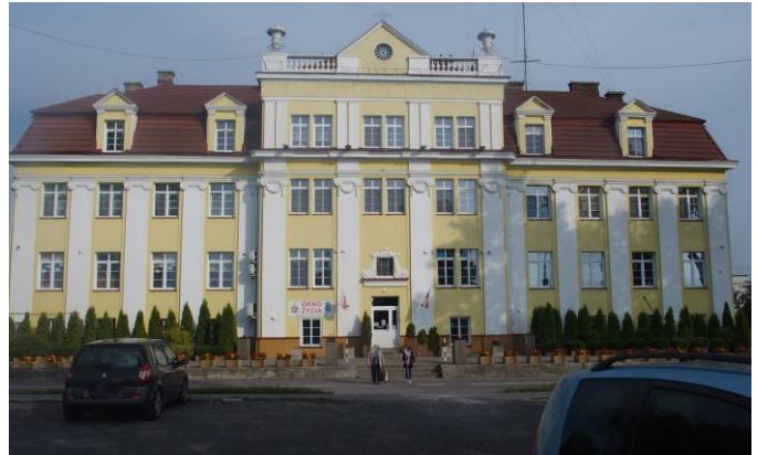
Fot. 6. Kasa Chorych, ob. Hospicjum Dom Ulgi w Cierpieniu im. Jana Pawła II, ul. Focha 5

Bank Pfeffera, ob. Komenda Powiatowa Policji, Al. 3 Maja 7 , wg projektu Stefana Szyllera. Dwukondygnacyjny, o symetrycznie skomponowanej fasadzie podzielonej ujętą w gzymsy strefą międzykondygnacyjną, w trzech osiach środkowych wzbogaconą obszernym balkonem wspartym na konsolach. Poziomo boniowany parter przepruty jest prostokątnymi oknami ze zwornikami w nadprożu, okna piętra - zamknięte łukiem okrągłym - zestawione po trzy, ujęte są szerokimi opaskami z dekoracją płycinową na wysokości węgarów; między oknami osi środkowych i w narożach wprowadzono pary pilastrów. Jest to wystrój eklektyczny korzystający z zasobów elementów dekoracyjnych baroku i renesansu.