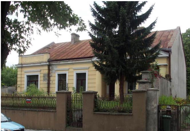
Fot. nr 11. Dworek inż. Straussa, ul. Siennieńska 37