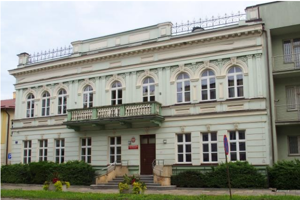
Fot. nr 5. Bank Pfeffera, ob. Komenda Powiatowa Policji, ul. Al. 3 Maja 7

Spośród innych budynków, ze względu na prezentację walorów stylów historycznych, wymienić należy: