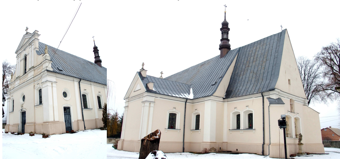
Zdjęcia nr 20, 21. Kościół parafialny pw. św. Stanisława Biskupa, ul. Szkolna 23

- kościół parafialny pw. św. Stanisława Biskupa, ul. Szkolna 23