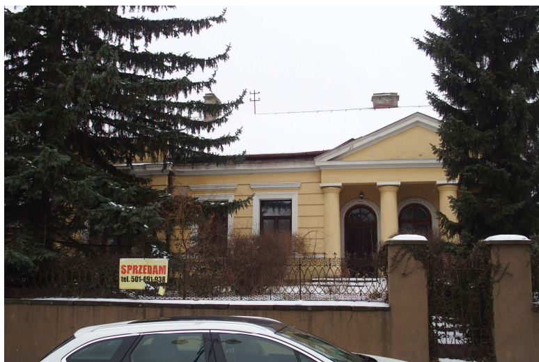
Zdjęcie nr 8. Dworek inż. Straussa, ul. Siennieńska 37