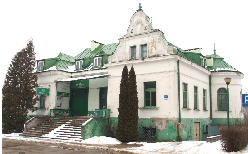
Zdjęcie nr 4. Pałacyk Rylla, ob. bank, Al. 3 Maja 13a

Pałacyk Rylla, ob. bank, Al. 3 Maja 13a , zbudowany w 1919 r. Wybudowany dla rodziny Ryllów ok. 1910 r. Po wojnie przez nich zamieszkały. Do 1977 r. w budynku mieściły się biura Ostrowieckich Zakładów Gastronomicznych, potem drukarnia.