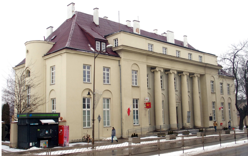
Zdjęcie nr 1. Budynek poczty, Al. 3 Maja 12

Budynek zaprojektowany w 1923 r. przez arch. Witold Minkiewicz, budowa trwała w latach 1925 - 1927, dwupiętrowy gmach poczty otwarto dnia 01.07.1927 r. Budynek wyróżnia się monumentalną kolumnadą w stylu palladiańskim. W podwórku znajdował się budynek gospodarczy i mieszkalny powstałe w tym samym czasie. Nad głównym wejściem umieszczony był Orzeł i data 1925 - 1927. Obiekt przez wiele lat był budynkiem reprezentacyjnym miasta. Poczta była również często wykorzystywana jako motyw ikonograficzny przy wydawaniu kart pocztowych (m.in. autorstwa T. Rekwirowicza).