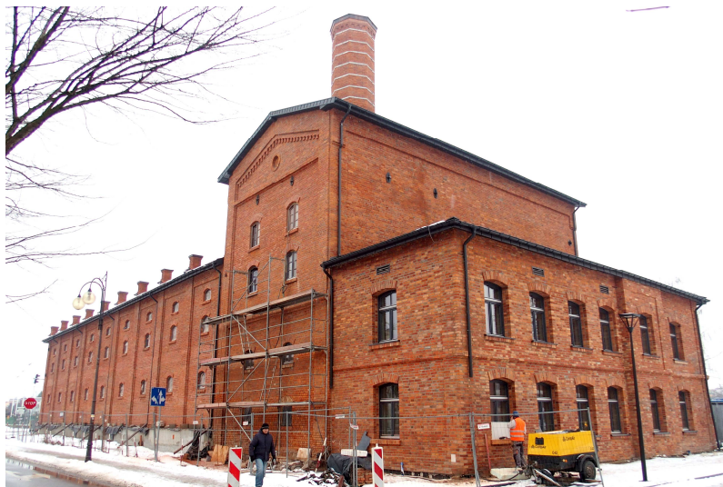
Zdjęcie nr 5. Zespół browaru Saskich, ob. Miejskie Centrum Kultury i Biuro Wystaw Artystycznych, ul. Siennieńska 54

Zespół browaru Saskich, ob. Miejskie Centrum Kultury i Biuro Wystaw Artystycznych, ul. Siennieńska 54 , zbudowany w 1906/1910 r., jest typowym przykładem dziewiętnastowiecznej architektury przemysłowej.