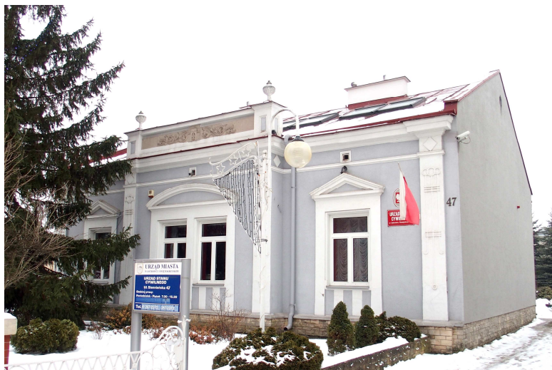
Zdjęcie nr 9. Willa Saskich, ul. Siennieńska 47