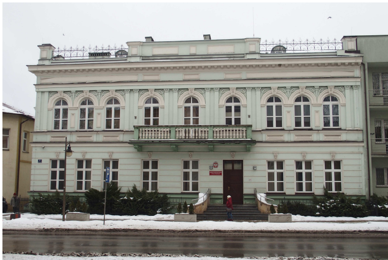
Zdjęcie nr 2. Bank Pfeffera, ob. Komenda Powiatowa Policji, ul. Al. 3 Maja 7

Bank Pfeffera, ob. Komenda Powiatowa Policji, Al. 3 Maja 7 , budynek zaprojektowany przez Stefana Szyllera w stylu eklektycznym na pocz. XX w.