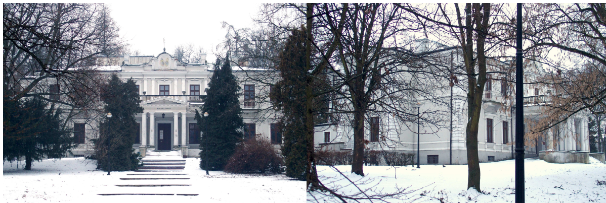
Zdjęcia nr 12, 13. pałac, ob. Muzeum Historyczno - Archeologiczne w Ostrowcu Świętokrzyskim, ul. Świętokrzyska 37

Pałac położony w rozległym parku wybudowany w eklektycznym stylu, w latach 70. XIX w. dla hrabiego Zygmunta Wielopolskiego, w którym obecnie mieści się Muzeum Historyczno - Archeologiczne.