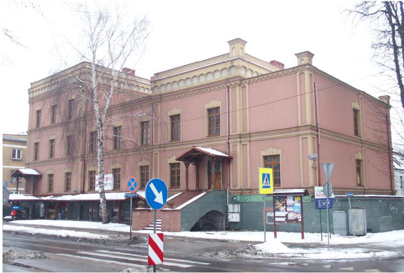
Zdjęcie nr 19. Dawny Hotel Fabryczny, ul. Sandomierska 4

- dawny Hotel Fabryczny, ul. Sandomierska 4, z XIX w., gdzie w czasie rewolucji 1905 r. znajdowała się siedziba władz Republiki Ostrowieckiej.