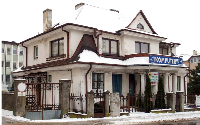
Zdjęcie nr 7. Willa Żakowskich, ul. Siennieńska 14