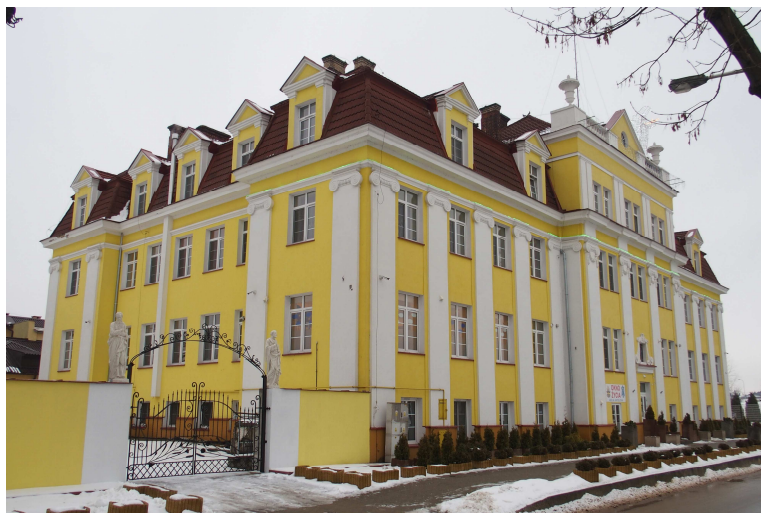
Zdjęcie nr 14. Dawny gmach Kasy Chorych, ob. Środowiskowy Dom Samopomocy dla Osób Niepełnosprawnych Intellektualnie oraz Dom Ulgi w Cierpieniu im. Jana Pawła II, ul. Focha 5

W 1893 r. powstały dwupiętrowe kamienice fabryczne, a w 1894 r. szpital fabryczny, który do powstania kasy chorych na ul. Focha 5 (ob. Środowiskowy Dom Samopomocy dla Osób Niepełnosprawnych Intellektualnie oraz Dom Ulgi w Cierpieniu im. Jana Pawła II), był jedynym szpitalem w najbliższej okolicy. W 1903 r. Izabela Łempicka otworzyła w Klimkiewiczowie czytelnię i księgarnię. W 1907 r. osada miała już 27 domów i 825 mieszkańców.