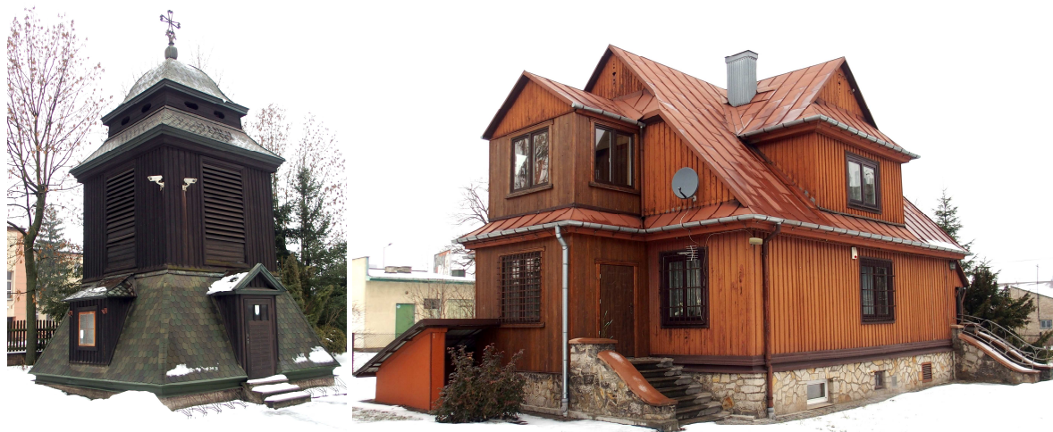
Zdjęcia nr 17, 18. Dzwonnica i plebania przy kościele parafialnym pw. Najświętszego Serca Jezusowego, tzw. hutniczy, ul. Poniatowskiego 4

Obok kościoła usytuowana jest drewniana dzwonnica z 1939 r., na której obecnie znajdują się trzy dzwony oraz krzyż z 1881 r. poświęcony pracy górników ostrowieckich. W 1949 r. postawiono drewnianą plebanię.