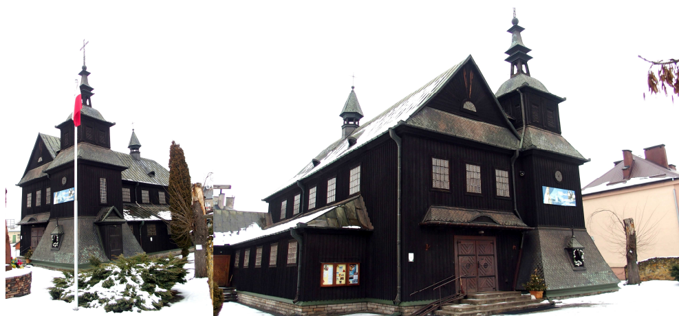
Zdjęcia nr 15, 16. Kościół parafialny pw. Najświętszego Serca Jezusowego, tzw. hutniczy, ul. Poniatowskiego 4

- kościół parafialny pw. Najświętszego Serca Jezusowego, tzw. hutniczy, ul. Poniatowskiego 4