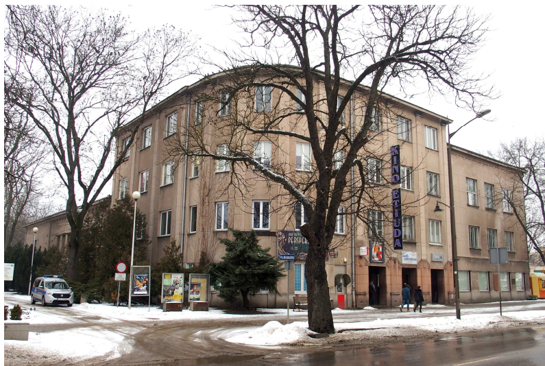
Zdjęcie nr 3. Kino Etiuda, Miejskie Centrum Kultury (dawny Zakładowy Dom Kultury), Al. 3 Maja 6

Kino Etiuda, Miejskie Centrum Kultury (dawny Zakładowy Dom Kultury), Al. 3 Maja 6 , budynek socjalistyczny zbudowany w latach 1937 - 1953 wg projektu Jerzego Wajdlinga. Projekt modernizowany był przez Tadeusza Rekiwiczca.